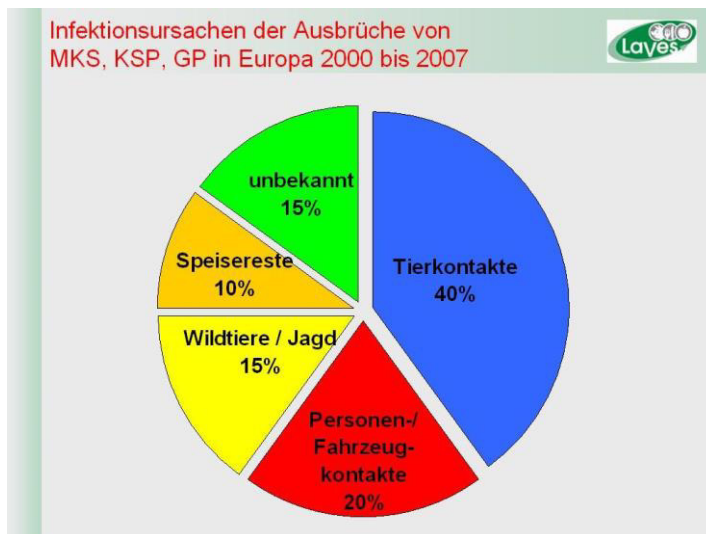
Abb.1: Anteile verschiedener Übertragungswege an den Infektionsursachen für Tierseuchen

Voraussetzung für eine indirekte Übertragung von Krankheitserregern ist die Existenz von Überträgern oder Vektoren. Man unterscheidet zwischen belebten Vektoren (Personen, Tiere anderer Arten, Wildtierpopulationen, Schadinsekten, Zecken, Stechmücken etc.) und unbelebten Vektoren (Fahrzeuge, Geräte und Instrumente, Futter und Wasser).